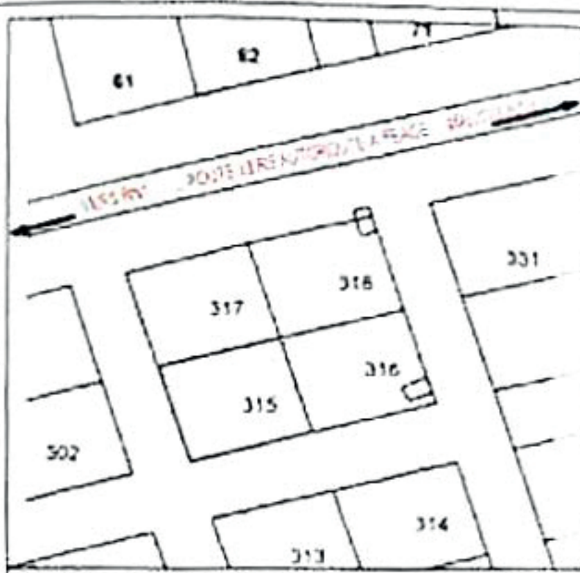
PLAN DE SITUATION ECHELLE = 1:2 000